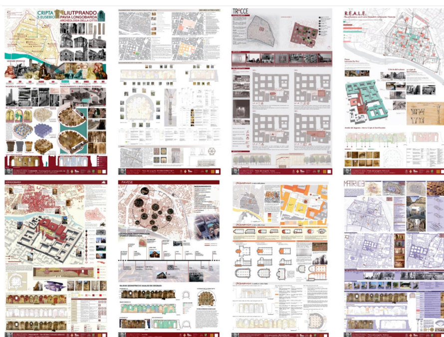
Figura 8. Universidad de Pavía. Resultados de los proyectos de restauración de la Cripta de San Eusebio por parte de los estudiantes del curso de Restauración de la Arquitectura (archivo del curso de Restauración de la Arquitectura, UNIPV).

Así, la Ciencia y la Tecnología tienen una tarea muy compleja: la de investigar, analizar y conocer el patrimonio que hemos recibido como regalo para transmitirlo y hacerlo accesible a las nuevas generaciones. La importancia de la relación entre la ciencia y la tecnología es un vínculo inherente a la propia obra.