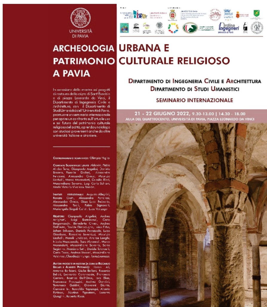
Figura 9. Universidad de Pavía. Seminario internacional

Esta experiencia se implementa así dentro de las iniciativas educativas que las escuelas y universidades deben