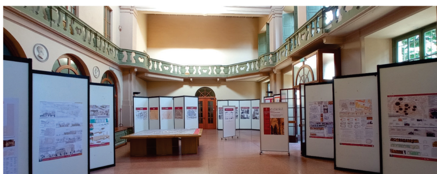
Figura 10. Universidad de Pavía. Exposición de proyectos de restauración de la cripta de San Eusebio y de valorización de la plaza Leonardo da Vinci por parte de los estudiantes del curso de restauración arquitectónica.