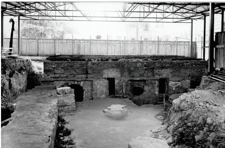
Figura 4. Pavía. Cripta de Sant'Eusebio a través de imágenes del archivo Chiolini (foto 1968), Museos Cívicos, Ayuntamiento de Pavía (archivo del curso de Restauración de la Arquitectura, UNIPV).