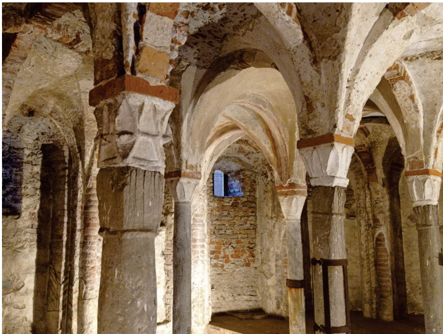
Figura 3. Pavía. Cripta de Sant'Eusebio en la plaza Leonardo da Vinci. Detalle de los capiteles del periodo lombardo.