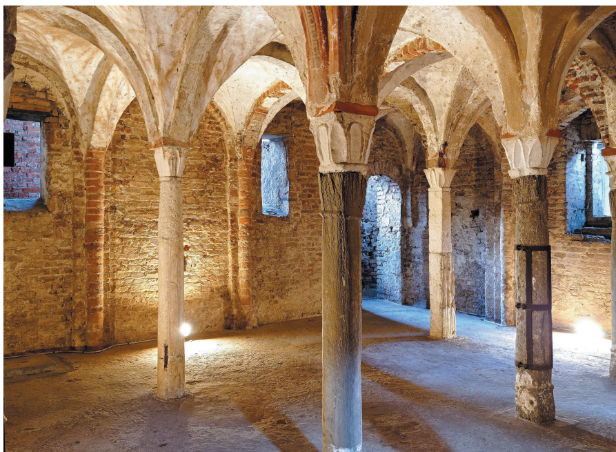
Figura 2. Pavía. Cripta de Sant'Eusebio en la plaza Leonardo da Vinci. Detalle de los capiteles del periodo lombardo (archivo del curso de Restauración de la Arquitectura, UNIPV).

A pesar de que diversas restauraciones realizadas desde los años 30 del siglo pasado han comprometido gravemente su estructura y las obras de arte que alberga, la cripta representa hoy un legado fundamental dentro del centro histórico de la ciudad de Pavía, hasta el punto de que ha sido identificada como un patrimonio a conservar en diálogo con un proyecto de valorización de la plaza Leonardo da Vinci, rodeada de importantes edificios universitarios.