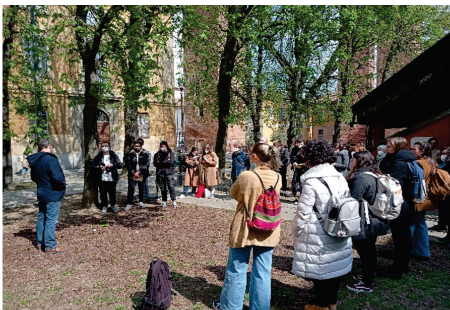
Figuras 6 - 7. Pavía (Italia). Reuniones con la comunidad académica y de la ciudad para compartir el proyecto de restauración de la Cripta de San Eusebio (abril de 2022, archivo del curso de Restauración de la Arquitectura, UNIPV).