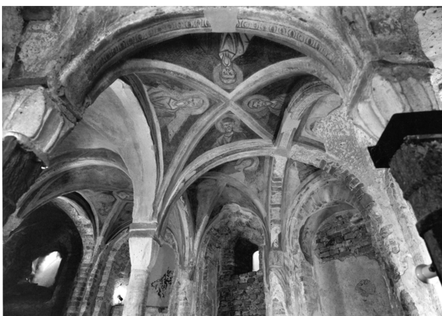
Figura 5. Pavía. Cripta de Sant'Eusebio a través de imágenes del archivo Chiolini (foto 1975), Museos Cívicos, Ayuntamiento de Pavía (archivo del curso de Restauración de la Arquitectura, UNIPV).